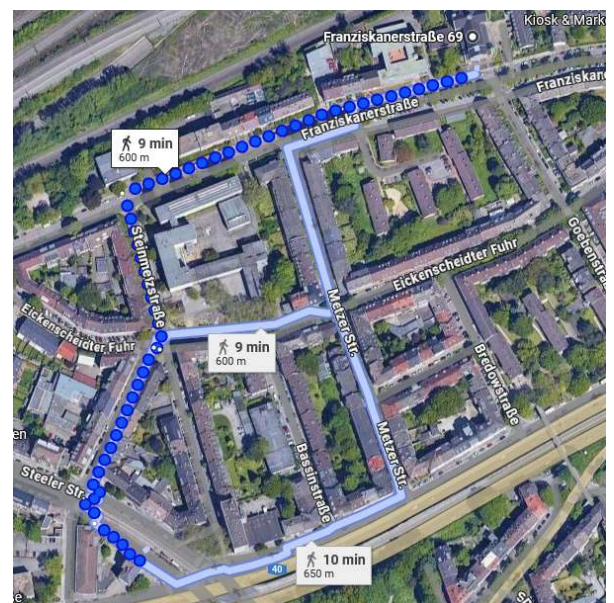
bzw. Wasserturm